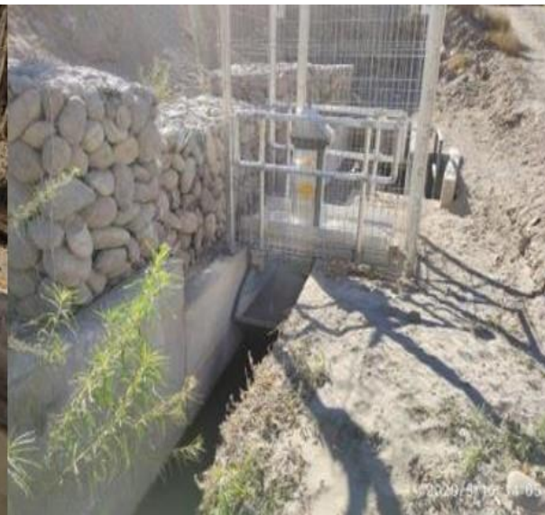
Foto 2. Canal Las Vizcachas.