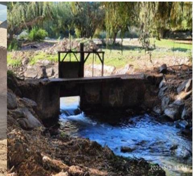
Foto 4. Canal Agustinos.