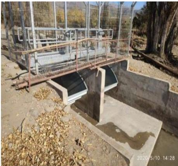
Foto 1. Canal San Miguel.