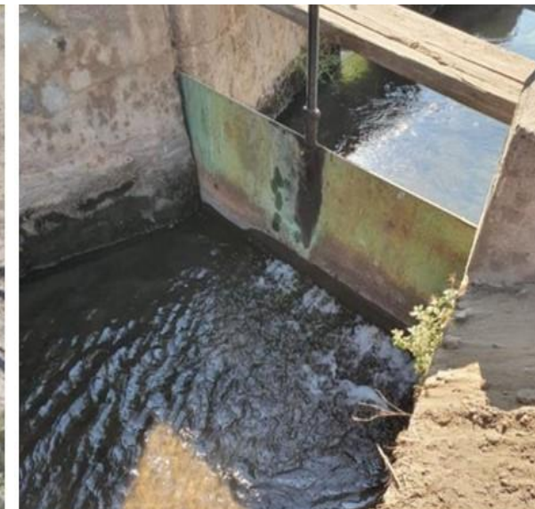
Foto 3. Canal Campino.